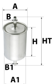
Photo d'illustration pour les dimensions