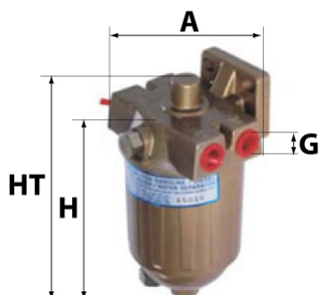
Photo d'illustration pour les dimensions